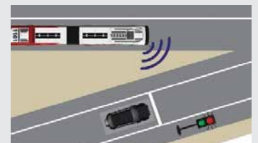
Sistema de prioridad de transporte público de medición de rampa