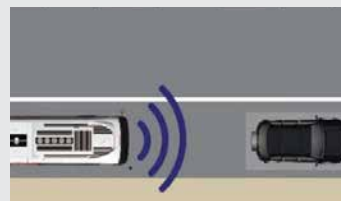
Advertencia de colisión frontal