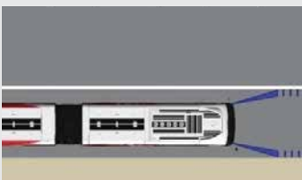
Advertencia de salida de carril