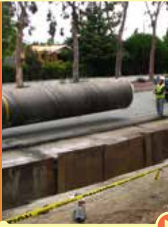
Reubicación de servicios públicos