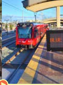
Pruebas e inicio