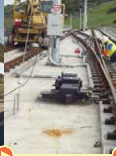
Instalación del ferrocarril y electricidad