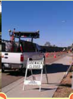
Construcción de infraestructura