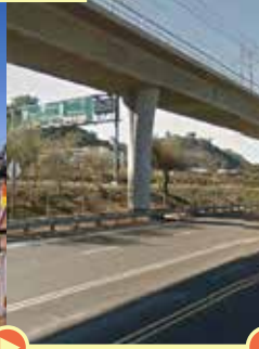
Construcción de estaciones, puentes y viaductos