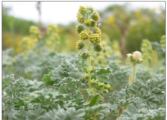
Los esfuerzos de mitigación ambiental protegen, conservan y recuperan plantas nativas como la Ambrosia de San Diego.