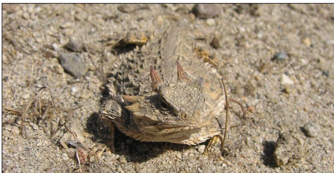
Los cruces para animales y el alambrado direccional facilitan el movimiento de los lagartos cornudos de la costa ( phrynosoma coronatum ) y otras criaturas silvestres.