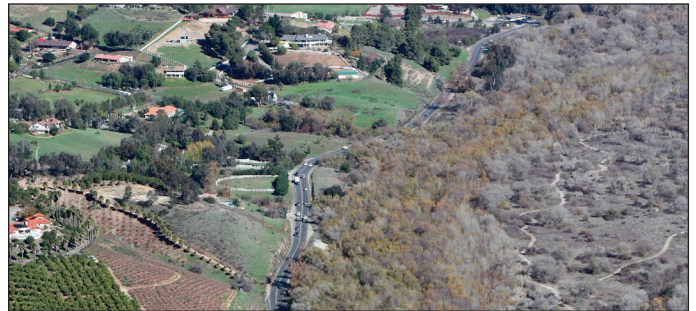
Minimizar los impactos ambientales es un componente importante del proceso de toma de decisiones.

De conformidad con la Ley Nacional de Normas Ambientales (National Environmental Policy Act) y la Ley de Calidad Ambiental de California (California Environmental Quality Act), se preparó un Borrador del Reporte de Impacto Ambiental/de la Declaración del Impacto Ambiental (EIR/EIS). El mismo comparó y analizó dos alternativas de construcción, el Trazo Existente y el Trazo Sur, en comparación con la alternativa de no construir nada, para determinar de qué manera cada una de las alternativas tendría