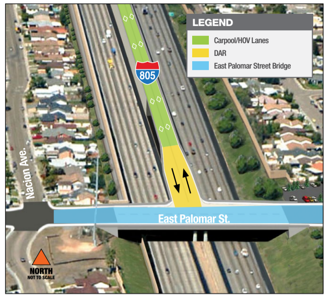
The Direct Access Ramp connects the carpool/HOV lanes to local surface streets.

Vehicles can access the DAR via the East Palomar Street bridge, located between Raven and Nacion avenues. These vehicles include transit, carpools, vanpools, motorcycles, and solo drivers in permitted clean-air vehicles. Carpools and vanpools not only save money and time, they help the environment too. To learn more about carpool and vanpool options, please visit icommuteSD.com .