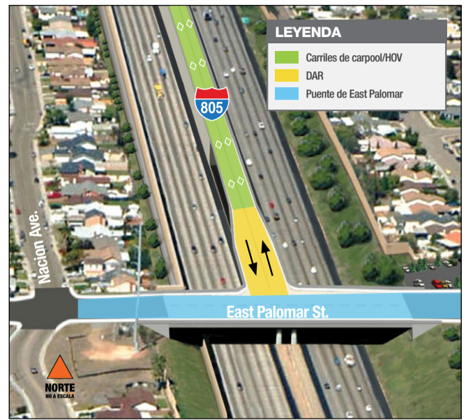
La Rampa de Acceso Directo conecta los carriles de carpool/HOV con las calles locales.

Aunque solo algunos motoristas pueden usar la DAR, todos los conductores, ciclistas y peatones pueden usar el nuevo puente apto para peatones de East Palomar Street para cruzar sobre la I-805. Vea en el infográfico que aparece abajo más información sobre cómo usar la DAR y el puente de East Palomar Street.