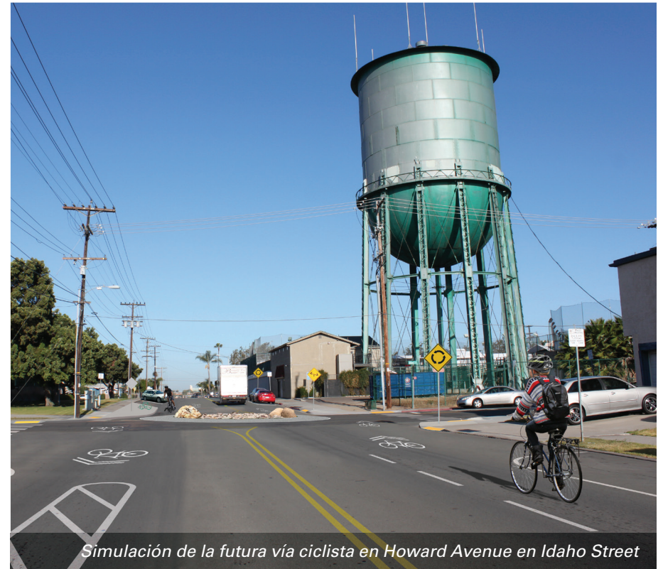
Simulación de la futura vía ciclista en Howard Avenue en Idaho Street